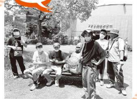
日帰り活動 日本モンキーセンター