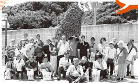
日帰り旅行 (おやつカンパニー)