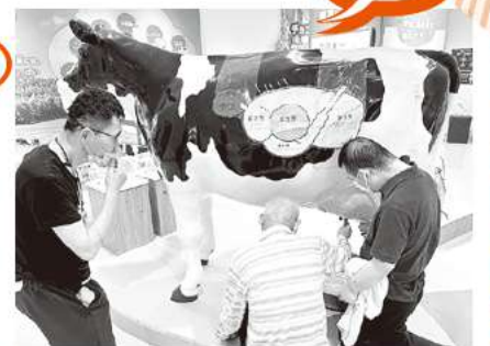
日帰り活動 明治乳業工場見学